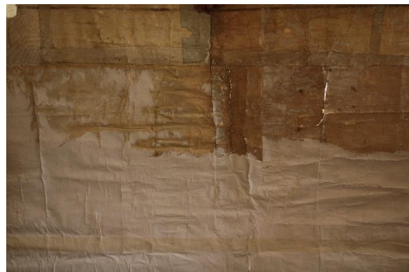
Particolari presenza carta adesa al verso